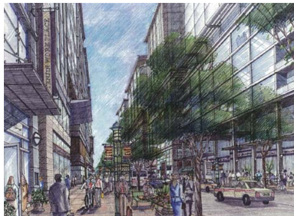
◇天神明治通りの将来像